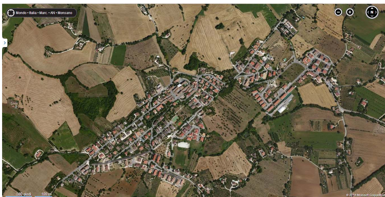
Figura 1 – Immagine zenitale del territorio di Monsano (AN), in alto a dx dell'immagine è ubicato il Cimitero Comunale