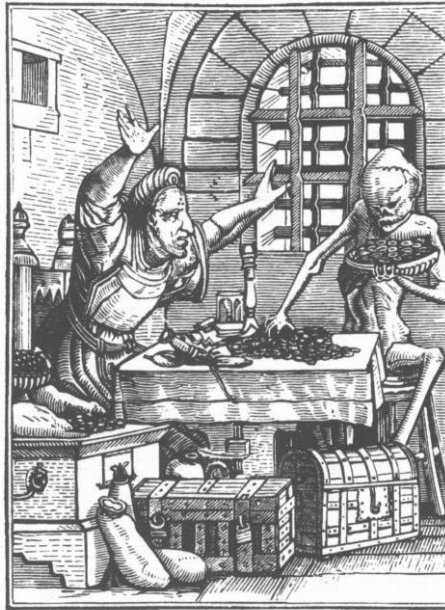
Holbein il Giovane – Totentanz 1538; la Morte e il banchiere