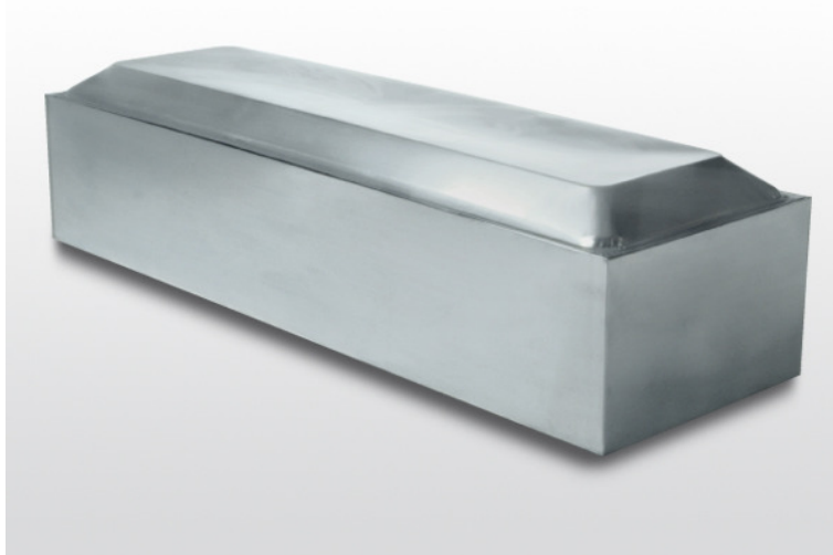
Cassone in zinco per fasciatura di feretri o per esumazioni/estumulazioni; Mod. CEABIS – Vezzani spa