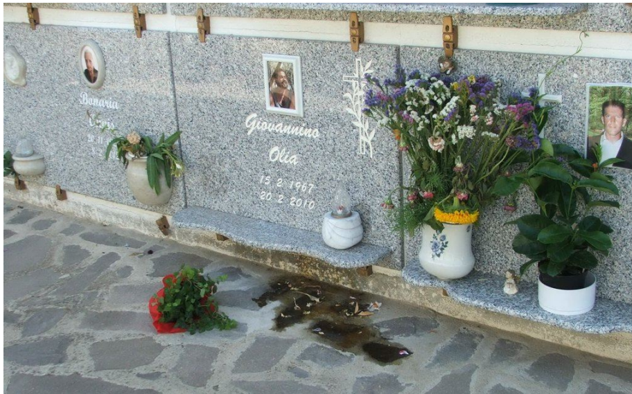
Percolamento di liquidi cadaverici da loculo del cimitero di Sardara (VS) (tratto da www.unionesarda.it del 25/07/2013)