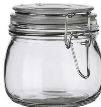
Barattolo ermetico in vetro: lo stesso principio deve essere usato coi loculi

- in primo luogo sono da ricondurre ad un difetto nella confezione della chiusura della cassa metallica per una non corretta saldatura o per l'eccessiva pressione raggiunta all'interno della stessa, conseguente ad un difettoso funzionamento della valvola depuratrice e/o per un difetto costruttivo della stessa cassa metallica, che nelle parti di materiale piegato, in seguito anche alle sollecitazioni dovute all'elevata pressione, potrebbero essersi ulteriormente indebolite fino a fessurarsi, consentendo sia fuoriuscita di liquidi che dei gas;