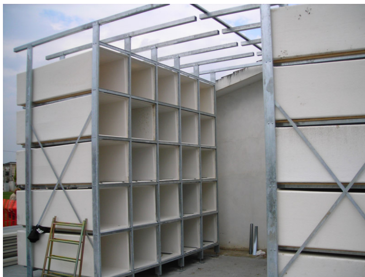
Esempio di costruzione prefabbricata di nuovi loculi con struttura in acciaio e "cassetto loculo" in vetroresina della Ditta FERRARINI SYSTEM di Villafontana di Oppeano (VR)