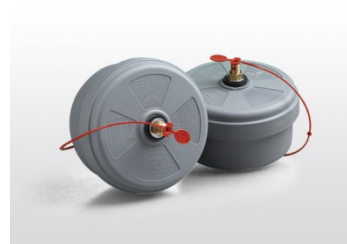
A sx immagine della Redazione di un cofano che simula il rigonfiamento per la pressione interna che si può determinare; a dx un es. di valvola depuratrice (mod. di CEABI – Vezzani spa)